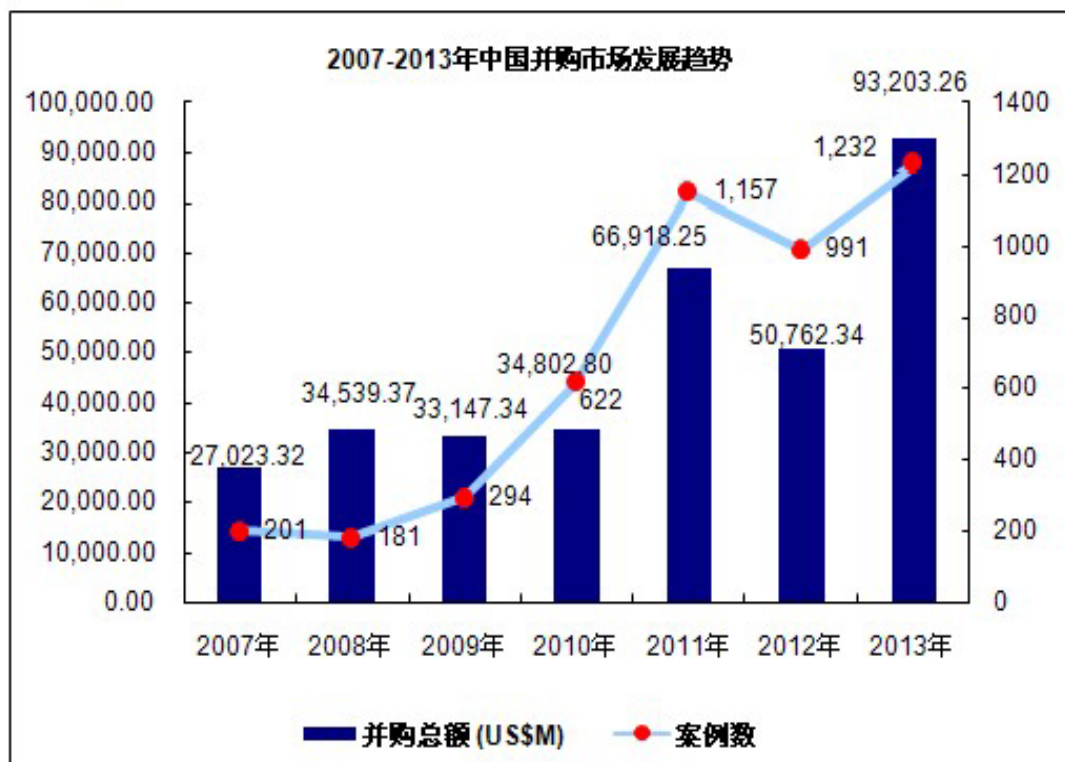
图 1 2007-2013 年中国并购市场发展趋势

从 2007 年到 2013 年，中国并购总额增长了 245%，并购案例数增长 513%，并购重组不仅在规模上快速增长，而且参与的企业越来越多，并购重组正在成为一项比较常见的经济活动。