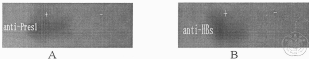
图3 pDEST32-wS 转化 MaV203 Western bolt 检测 A. 抗-前-S1 单克隆抗体 B. 抗-HBs 单克隆抗体 注: + pDEST32-wS 转化 MaV203; - pDEST32 转化 MaV203