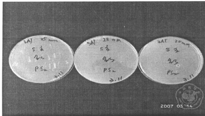
图 4 pDEST32-wS、pDEST32-pS、pDEST32-SHBs 与 pDEST22 共同转化 MaV203 后在不同浓度 3AT 培养基生长

按照 Invitrogen 公司酵母双杂交实验指南,将 pDEST32-wS、pDEST32-pS和 pDEST32-SHB s与 pDEST22 共同转化 MaV203,经过 3AT梯度实验证明,pDEST32-wS与 pDEST22 共同转化 MaV203后,在 28 mmol/L 3AT培养基中有微弱生长,在 30 mmol/L 3AT培养基中无生长;pDEST 32-SHB s和 pDEST32-pS2与 pDEST22 共同转化 MaV203后,在 28 mmol/L 3AT培养基中无生长(图 4)。