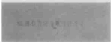
图 1 中肋骨条藻