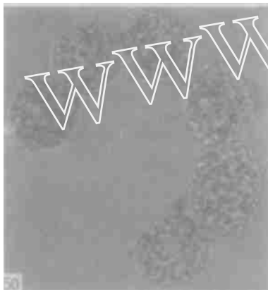
图 3 链状裸甲藻电镜照片

3.2 相当一部分船舶的压舱水管理状况不佳,造成局部区域的船舶压舱水无序排放。对船舶压舱水管理情况的调查表明:尽管绝大多数被调查船舶都宣称船上有符合相关规定的压舱水管理计划,并遵照执行,然而,从所查阅的一部分船舶的航海日记和压舱水测量记录等文书中却发现,不少船舶特别是航线较短的船舶仅是做了一些书面工作,实际执行马虎了事,甚或根本没执行计划。如有两艘外籍集装箱船舶向检验检疫机构申报压舱水动态时一贯声明不排放压舱水,但其压舱水测量记录却是每隔 1-2 个星期向厦门港排放一次压舱水,时间竟持续一年!据航运业内人士称,类似情况在中国其他港口,甚至在世界许多其他的港口都不少见,究其原因,主要是船方为避免压舱水卫生处理而发生的费用。有一些压舱水管理计划比较完备的船舶,特别是大型集装箱船舶,在进港口之前曾向检验检疫机构申报压舱水排放,但当获悉需要支付实施卫生处理费后就改称不排放,或将在货物装载完毕后到港外排放,而他们的所谓“港外”,往往是离码头不足 10 海里,导致被排放的压舱水随着潮流很快回流进港,污染水域。