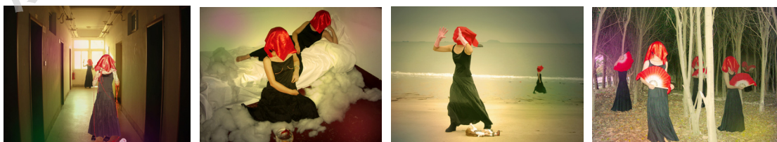
摄影作品《红盖头》 2007 入选美国 MCC 电子艺术节

不管怎么样，《红盖头》这个作品让我迈出了创作上的第一步。在接下来的实践中，我开始想要跳出女性象征性符号的圈子，在一个更广阔的空间里进行尝试。