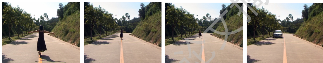
影像作品 《跟着路线走》 2008

从这个经历过程中，我得到了一个启示：对我个人而言，我萌发的一些个创作上的想法并不需要出自某一个事件、问题、和理性的思考，而可以出自与我自己身心体验中的某种感觉有微妙对应的一些个具体的事物。我选择，组织和我内心世界某种感觉对应的事物，再通过个人的因素加以强化，让长期积淀于个人体验中的生存感受在不经意的冲动中呈现出来。这是否就是上天赐予我的——与女性的特质有着某种关联的的创作秉性呢？