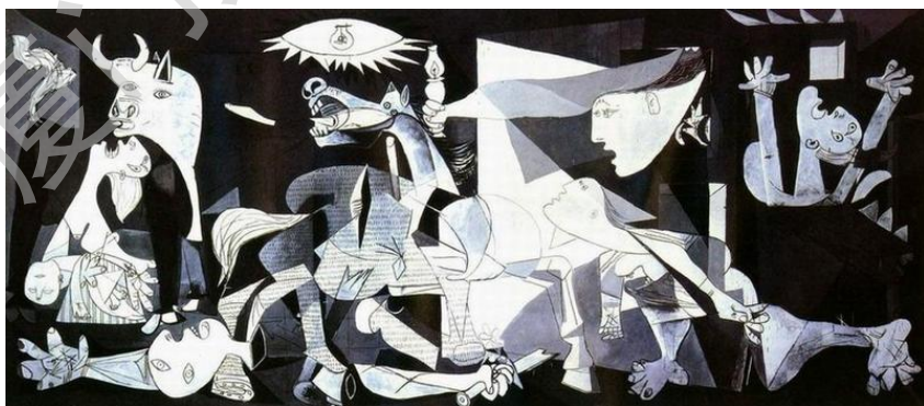
图3 毕加索 《格尔尼卡》

20 世纪最富盛名且极具创造力的绘画天才——毕加索（1881~1973）1937 年完成的大型壁画《格尔尼卡》（图 3）毫无疑问是毕加索在战争题材方面最具代表性的作品。在象征物及暗示手法的引用和处理上，极具个人特点和张力。同是表现战争题材，不同的画家有不同的思路与处理方法。戈雅的《法军屠杀起义者》就是这一题材中较突出的作品。该作品采用写实的表现手法。画中一排法军正举枪一一屠杀起义者，此时正要被屠杀的起义者的举动显示出被压迫人民的勇敢与反抗。这样的题材虽也能体现血腥，但在在我看来画中对这种场景的写实再现显得太过直白，不够含蓄。《格尔尼卡》中画家没有用写实的手法来表现战争，而是把脑中精心设置的象征物巧妙地组合在一起，通过象征物给人产生的心理暗示有力地表现战争给人造成的一种愤怒和不安的情绪，让观