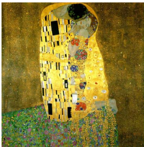
图2 克里姆特 《吻》

艺术风格及象征物在主题的表现上的应用。画面中间，两个拥抱接吻的人彼此紧紧地依偎在一起。男人头顶上花冠环绕，女人头上则用星形花朵点缀，这是他们之间甜美爱情的象征。在构思上，男人身上的斗篷装饰着垂直有力疏密有致象征着阳刚之气的长方形图案，女人的斗篷则是大小不均的圆形和曲线所组成的象征女性柔美的纹样。画家借助形状这一“抽象符号”作为象征物，通过暗示手法让观者产生不同视觉感受，暗示出他们的性别。人物脸部和四肢以淡彩渲染，而其余部分则是采用传统金银首饰工艺技法（镶嵌风格），以大块面金黄色装饰性色彩为背景。人物脚上缠绕的鲜艳花朵，犹如炽热的爱情已经成为金色的岩石，坚不可摧。画家巧妙地利用抽象符号、植物、色彩等象征物，通过暗示手法，达到灵与质的精神结合，深化了主题。