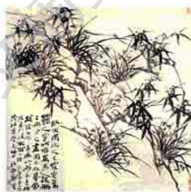
图1 中国 郑板桥作品(国画)

“混沌”本身就体现着一种不确定的耐人寻味的因素。中国古典绘画所体现的“空”、“灵”、“气韵”以及“墨分五色”——用有限的笔墨表现无限的意境等美学思想，都是为了在寻找一种不确定的混沌之美。