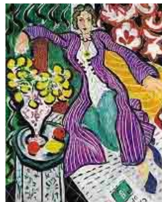
图 3 法国 马蒂斯 穿紫外套的女人(油画)

然而，西方古典绘画，尤其是古希腊和文艺复兴时期的艺术，是以理性作为其核心的，即使曾经存在的非理性、偶然性等不确定因素，经过历史的沉淀也逐渐转化为人们推崇与效仿的理性法则。西方的抽象绘画同样也是理性思想的产物，起源与对绘画的反思，而近代西方艺术中的反传统思潮，又加速了它的实现。到 19 世纪末和 20 世纪初，一种高扬人的生命力和直觉创造的趋势开始发展，唤起画家创作灵感的对象的不确定，使得绘画也产生了巨大的变化。例如德国的表现派和法国的野兽派声明自己是反对一切理论的、反对对艺术创造的普遍的有效的各种规定。规定、自觉和精神对他们来说都是“心灵的敌对者”和一切创造过程的大敌。他们认为艺术家不应当知觉他们所做的。（图 3）