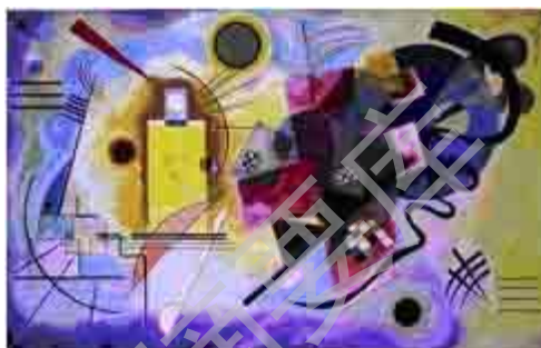
图 2 俄国 康定斯基作品(油画)

（Wassily Kandinsky） ① 是最典型的。他说：“在渴望能艺术地表现自己的精神生活时，一个不满足于现实生活和自然的画家，会情不自禁地羡慕音乐——这门目前最乏物质性的艺术竟会如此轻松自如地达到了这一目标。他会自然而然地将音乐的手法应用到他自己的艺术中去。对现代绘画中的节奏、对数里抽象结构、对色调的重复、色彩的流动等等的追求也就应运而生了。” ②