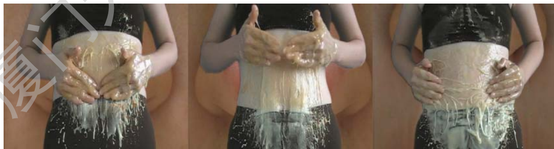
图2 行为影像作品《麦芽糖》2007