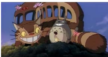
图1 《龙猫》截图 龙猫公车帮助姐妹俩

还有部分画面形象是对现实事物的具有超越性地改造，表现出了更加丰富的想象力。如宫崎骏动画中的“龙猫”、“猫巴士”（图1）。龙猫“多多洛”的胡子长得既像老鼠，身材有点像熊，十分巨大，虽然不能说人话，但能听懂人的语言，理解姐姐着急寻找妹妹小米的心情。“猫巴士”是一只巨大的花猫，它长长的身躯像一辆巴士，能够为客人提供柔软、舒服的座位，巴士车上还有萤火虫似的探路灯，行走速度非常快，所有的树木都要为它让路。《幽灵公主》中的麒麟兽（图2、图3），外形像温驯的羊和驯鹿，神情像一个冷静、睿智的留着长长胡须的印第安人。