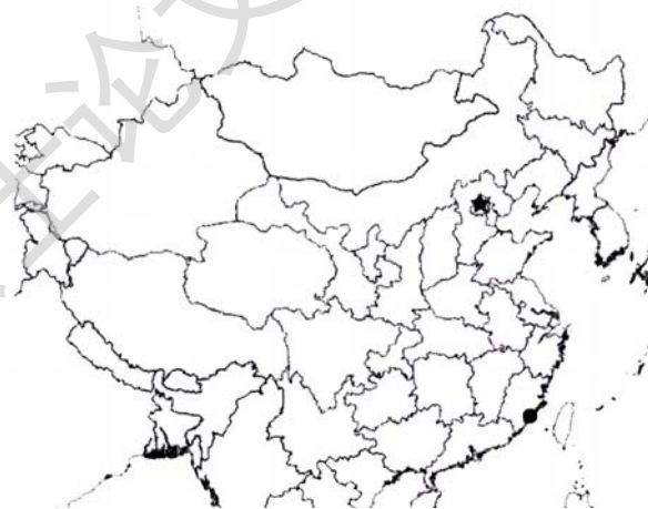
图 1-1 厦门市的地理位置

面积 1565 平方公里，人口 205 万，本岛面积 131 平方公里。厦门属于亚热带海洋性季风气候，阳光充沛，冬无严寒，夏无酷暑，且热湿同季，干冷同季，适合室内外活动。