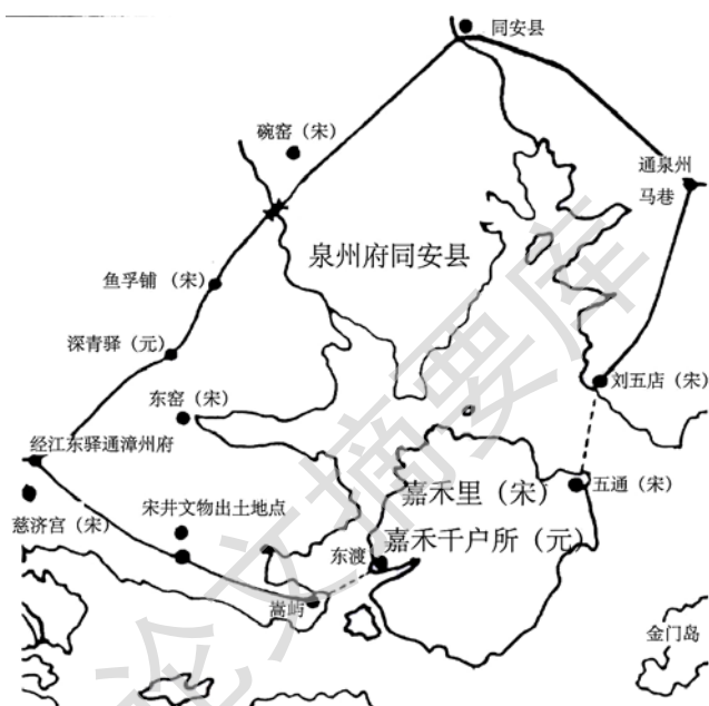
图 1-3 宋元时期厦门与内陆交通示意图

15世纪，明王朝即将厦门作为对西方开放的通商港。16世纪，厦门成为闽南的交通枢纽和主要外贸都会，城中不少居民从事商业贸易，与葡萄