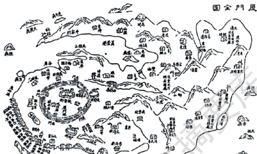
图 1-4 清道光年间厦门全图