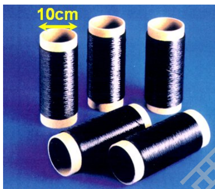
图 1.1.1 SiC 纤维照片 [1]

连续碳化硅纤维是一种高比强度、高比模量、耐高温、抗氧化、耐化学腐蚀的新型陶瓷材料，是先进复合材料的重要增强体之一。其形貌照片见图 1.1。