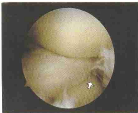
图 2 盘状半月板前角 R 区纵向撕裂, 箭头所在部位为破裂区