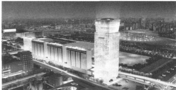
图 2 北京摩根中心鸟瞰图

让人欣慰的是,我们的很多老前辈们已经意识到了这一点。《华夏意匠》作者李允 先生认为,“现代建筑事实上包含着很多中国传统建筑的内容,它们之间有很多相同的原则,只不过是较为难于直接观察而已。”如果说《华夏意匠》里说的仍然有些乖巧和空洞,那么贝聿铭先生提出的“中国建筑师的当务之急,就是探索一种建筑形式,它既是有限的物力所能及的,同时又是尊重自己文化的”观点则鲜明了很多。《北京宪章》里也曾有一段话:“文化是历史的积淀,留存于城市与建筑中,融合在人们的生活中,对城市的建造、市民的观念和行为起着无形的影响,是城市 and 建筑之魂……技术和生产方式的全球化带来了人与传统地域空间的分离,地域文化的多样性和特色逐渐衰微、消失;城市 and 建筑的标准化和商品化致使建筑特色逐渐衰退,建筑文化和城市出现趋同现象和特色危机。”