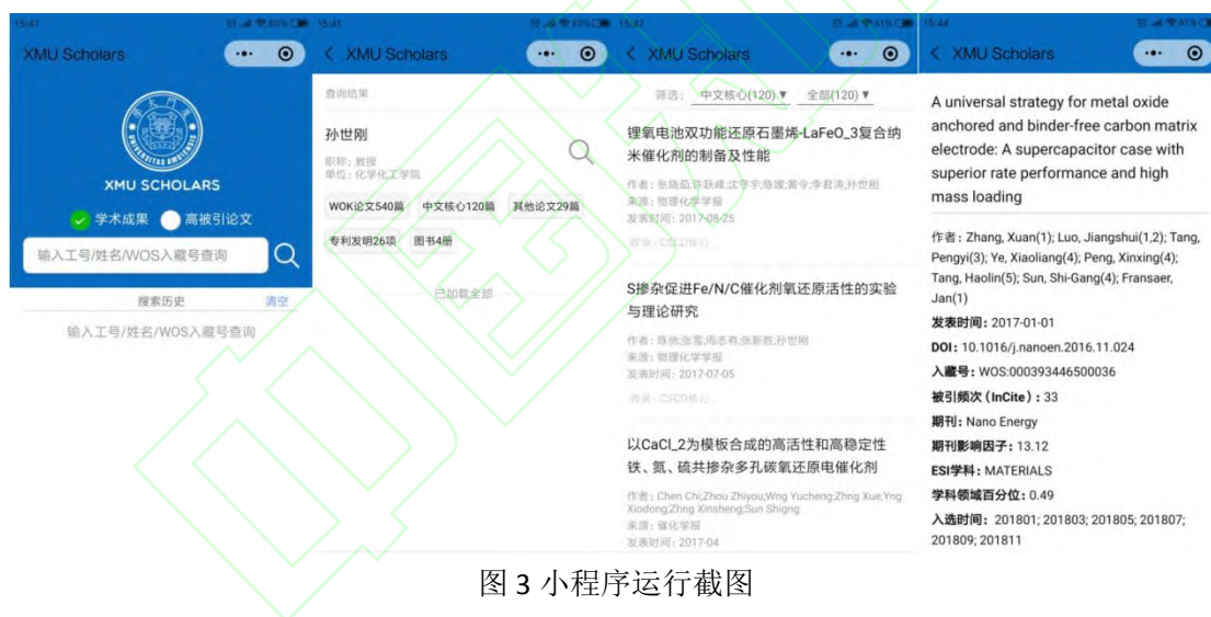
图3 小程序运行截图