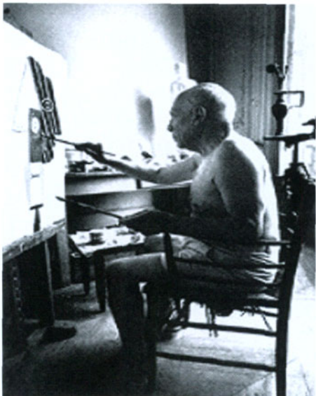
图4 作画时的毕加索

并没有因此否定自己，相反他坚信自我的追求。在接下来的几年内，他继续沿着这条轨迹创作了《三个女人》、《弹吉他的男人》、《穿衬衫的妇女》等作品。1912年他与布拉克合作纸贴画，发展成成立体主义。