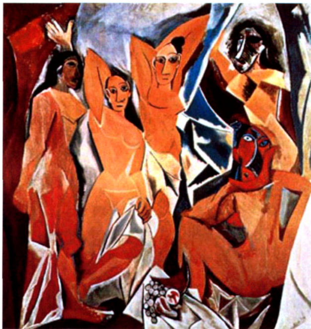
图3 亚威农少女 毕加索

1907年，具有标志性意义的作品《亚威农少女》（如图3）诞生了，这是立体主义的开山之作，但这也是一幅令当时所有人都瞠目结舌的一幅画。在这幅画中，5个不成人形、面目狰狞的裸女直视着观众。她们的表情怪异，让观众毛骨悚然。这幅画打破了传统的审美观，取而代之的是丑陋变形的面容、扭曲错位的形象。这样的一幅画无疑受到了众人批判。他的朋友们看到这幅画都陷入了可怕的沉默。安德雷·德兰还滑稽的宣称：“有一天人们会发现毕加索将吊死在自己的画像后面。” [2] 毕加索身边到处充斥着无情的诋毁和倒喝。他感到自己逐渐被朋友离弃，但他