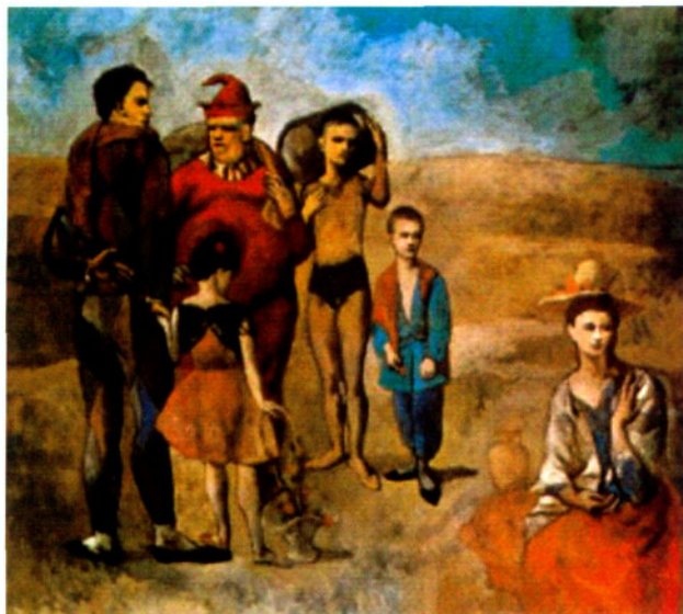
图2 江湖艺人 毕加索

父亲的拐杖、画笔、鸽子等无一例外地成了他的模特。8岁时便创作了第一幅油画《骑在马上斗牛士》。1901年，20岁的毕加索已经小有名气，但这个时候，他的生活状况并不乐观，经济拮据，好友卡萨吉玛斯因失恋自杀，与女友热尔梅娜之间的三角恋关系也让毕加索非常困惑，这一切的原因触发了他以蓝色基调作画的动机。他用蓝色表达着贫困，苦难，忧郁……查尔斯·莫里斯曾在为《法兰西信使》所写的文章中评论毕加索说：“无奈的悲哀影响了这个年轻人的所有作品……他描绘的人大多露出一副苦相，没有笑容。他的世界并不比麻风病人的病房更适合居住。他的画本身也是病魔缠身……” [1] 这篇文章尖锐地指出了毕加索这个时期的绘画特点，而当时也没有多少人愿意收藏他的这一系列哀伤的作品。为此毕加索感到失意，这也使他处于人生中相对晦暗的低谷时期。此时的毕加索连最基本的生理需要都没有得到极大化满足。马斯洛认为，人类基本需求被满足的程度会直接影响他的身心健康，此时的毕加索是忧郁的、痛苦的、悲凉的，毕加索把这些情绪一一展现在他的作品里，代表作有《蓝色的房间》（如图1）、《卡萨吉玛斯的葬礼》、《人生》等。