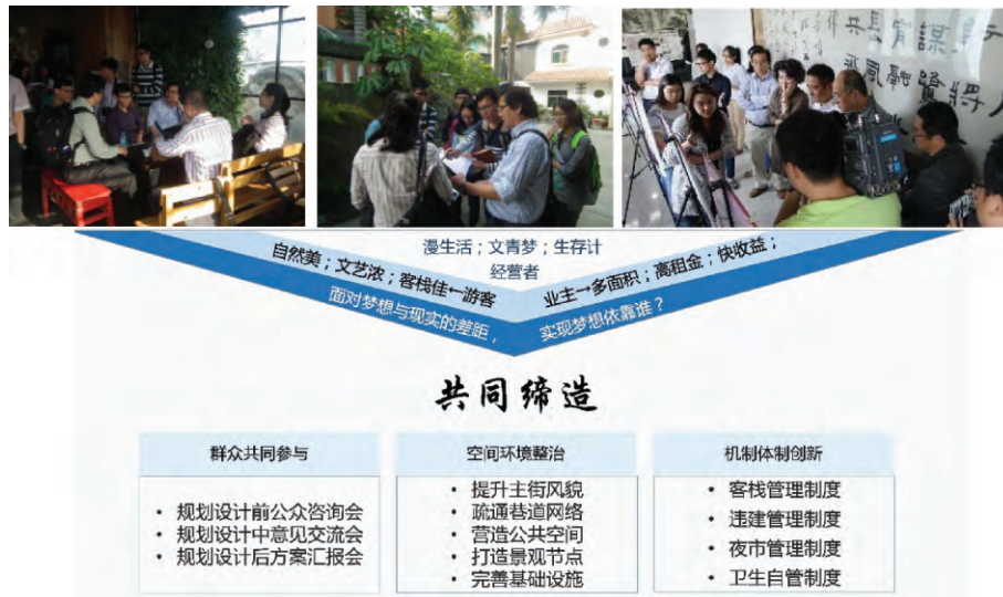
图4 曾厝垵社区工作坊的工作过程及议题

展既是政府对改变管理机制的表态,也是对社区共治中各方角色的激励:在由基层政府促成的社区多个自治组织和平台中,鼓励社区组织通过统筹资源和力量进行自我管理。政府管理机制的变革对社区共治格局的形成产生了重要的推力,为曾厝垵社区内部的良性管理奠定了重要基础。