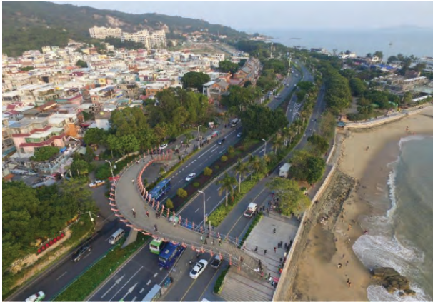
图2 优越的自然环境为曾厝垵带来发展动力