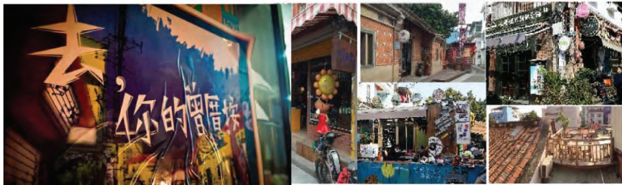
图5 曾厝垵文创村艺术海报及创意店铺

(2) 社区特色的营造: 截至 2015 年 10 月统计, 在面积仅 1.25km 2 的社区内共汇聚了包括画家、雕塑家、音乐人及各类文化创业者共计超过五千名, 开设创意店铺约 1600 家(其中旅馆 300 家, 美食 750 家, 文艺店铺 360 家, 其他店铺、工作室、文创企业类共约 190 家) [4] 。曾厝垵的持续活力与其文艺特色息息相关, 然而在国内旅游景区同质化的大趋势中, 如何保留独有的特色则是未来发展需要面对的挑战。曾厝垵最初受到认可的特色在于渔村、文化创意及文艺气息, 这不仅与空间环境相关, 也与入驻的人群及店铺业态联系密切。在其中, 文创会发挥了主要作用, 包括推进曾厝垵文创村的网络宣传平台、指导店铺的更新改造设计、制作曾厝垵推广策划等。同时, 为了鼓励商铺多进行文艺创作, 基层政府及文创会自 2014 年起, 每年评选出十个文艺店铺进行资金扶持。2015 年, 基层政府及文创会共同组创了曾厝垵众创空间, 由政府提供低租场所及资金补助, 为创业者提供创业环境及资源, 由文创会进行培育扶持, 形成开放互助式的创业生态系统, 为曾厝垵原创性文化特色的持续发展奠定了重要基础。