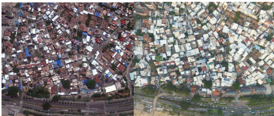
图3 曾厝垵2010年(左图)、2015年(右图)鸟瞰对比

在曾厝垵错落的街巷中,街角的涂鸦、彩绘、醒目而文艺的店招形成了强烈而连续的视觉冲击力,会使人忘记其曾经的城中村身份。但从屋顶第三立面来看曾厝垵,会发现它与其他自发性建设、填充、发展起来的城中村并无两样(图3)。2003年原曾厝垵村委会实现了“村改居”的转型,为后续作为