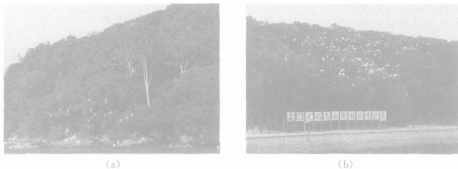
图 2 养殖白鹭招引的野生鹭类集群

2002 年和 2003 年圈养白鹭的存活率分别为 80% 和 91.25%, 其中死亡率以 7 ~ 8 月份为最高, 2002 年和 2003 年圈养白鹭在 7 ~ 8 月份期间的死亡率分别占死亡总数的 80% 和 71%. 圈养白鹭的平均摄食量从每天每只摄食 130 g 食物的基础上逐渐增加(图 3), 5 ~ 15 周(50 ~ 120 日龄)摄食量维持在每天每只摄食 160 ~ 170 g, 圈养 16 周以后, 随着秋冬季节的到来, 白鹭摄食量出现较大幅度的增长, 繁殖时期白鹭的摄食量维持在每天每只摄食约 250 g 食物的稳定水平.