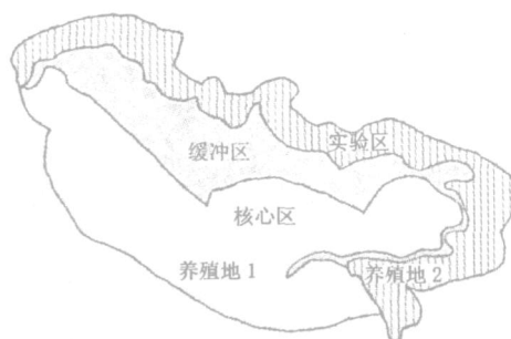
图1 厦门白鹭自然保护区大屿岛上的鹭类养殖位置

2002年和2003年的鹭类养殖地1和养殖地2分别位于厦门白鹭自然保护区大屿岛的不同位置(图1)。鹭类养殖地用尼龙网立地围隔形成, 占地面积约25 m 2 , 高度约4 m。2002年的鹭类养殖地位于岛上已有的深水水池边缘和小路旁边, 鹭类养殖地内只分布有1棵高度约2 m的龙眼树。2003年的鹭类养殖地及其周围皆是茂密的树林, 内分布有高度1~3 m的相思树以提供鹭类的营巢树, 地面建有占地面积约5 m 2 , 深度30 cm的流动水水池。