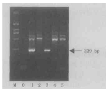
图 3 用 CMS 引物对 5 种水稻进行 PCR 反应的结果

采用已有的 SCAR 标记的引物和 CMS 引物,对上海市农业科学院作物育种栽培研究所送检的第 1 批 4 个杂交粳稻亲本的样品进行了分子鉴定。经与田间种植的结果比较,4 个样品的不育株率基本吻合,4 个样品纯度有 3 个基本吻合,另有 1