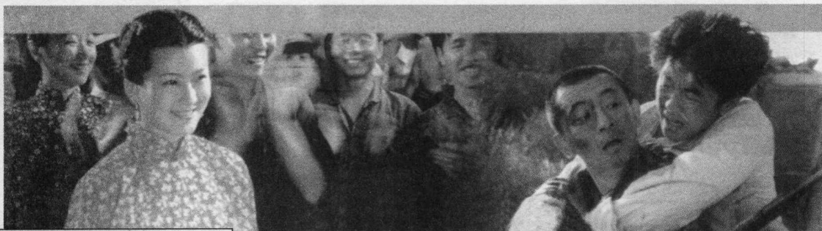
电视连续剧《台湾海峡》剧照。