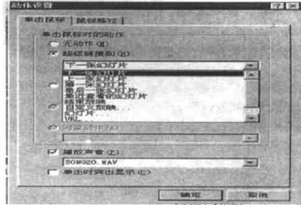
图5 “动作设置”对话框

“抄收系统”包括天丽鸟抄表收费系统的“系统安装”、“档案建立”、“抄表”、“收费”、“统计查询”、“其它功能”各项, 将这些内容利用插入文本框这个功能一一输入到幻灯片, 再将这些幻灯片超级链接到以上这些按钮, 链接过程如下: 指定一个对象, 如“系统安装”, 单击鼠标右键, 出现菜单, 选中“动作设置”弹出一对话框(如图 5), 选“超级链接”, 单击箭头, 出现下拉菜单, 选“幻灯片...”, 再选择相应的幻灯片号。