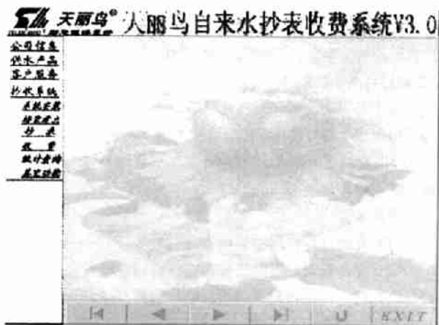
图 2 “自定义动画”对话框

为“欢迎使用”设置动画则使用“动画效果”工具栏上的自定义动画按钮, 出现“自定义动画”对话框(如图 2)有四个选项, 选择“效果”, 设置为“螺旋”效果。同样方法设置“天丽鸟抄表收费系统 V3.0”效果为“从左边缓慢移入”。有关公司信息的文本框动画效果设置为“随机”。放映时的效果就是“欢迎使用”旋转后, “天丽鸟抄表收费系统 V3.0”缓慢移入, 再弹出公司信息。