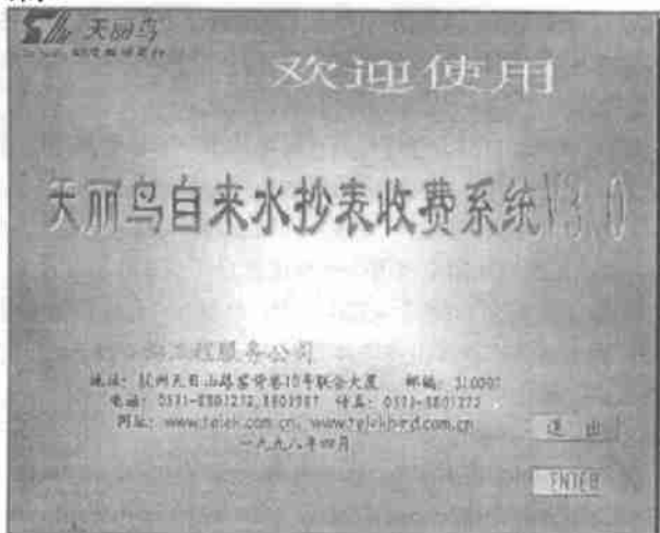
图 1 演示系统启动画面

启动 PowerPoint 后, 在启动对话框的“新建演示文稿”栏的三个选择按钮“内容提示向导”、“模板”、“空白演示文稿”中选择“空白演示文稿”, 则出现一张空白幻灯片, 可以利用各种工具在上面进行设计。制作完成的界面显示如图 1 所示: