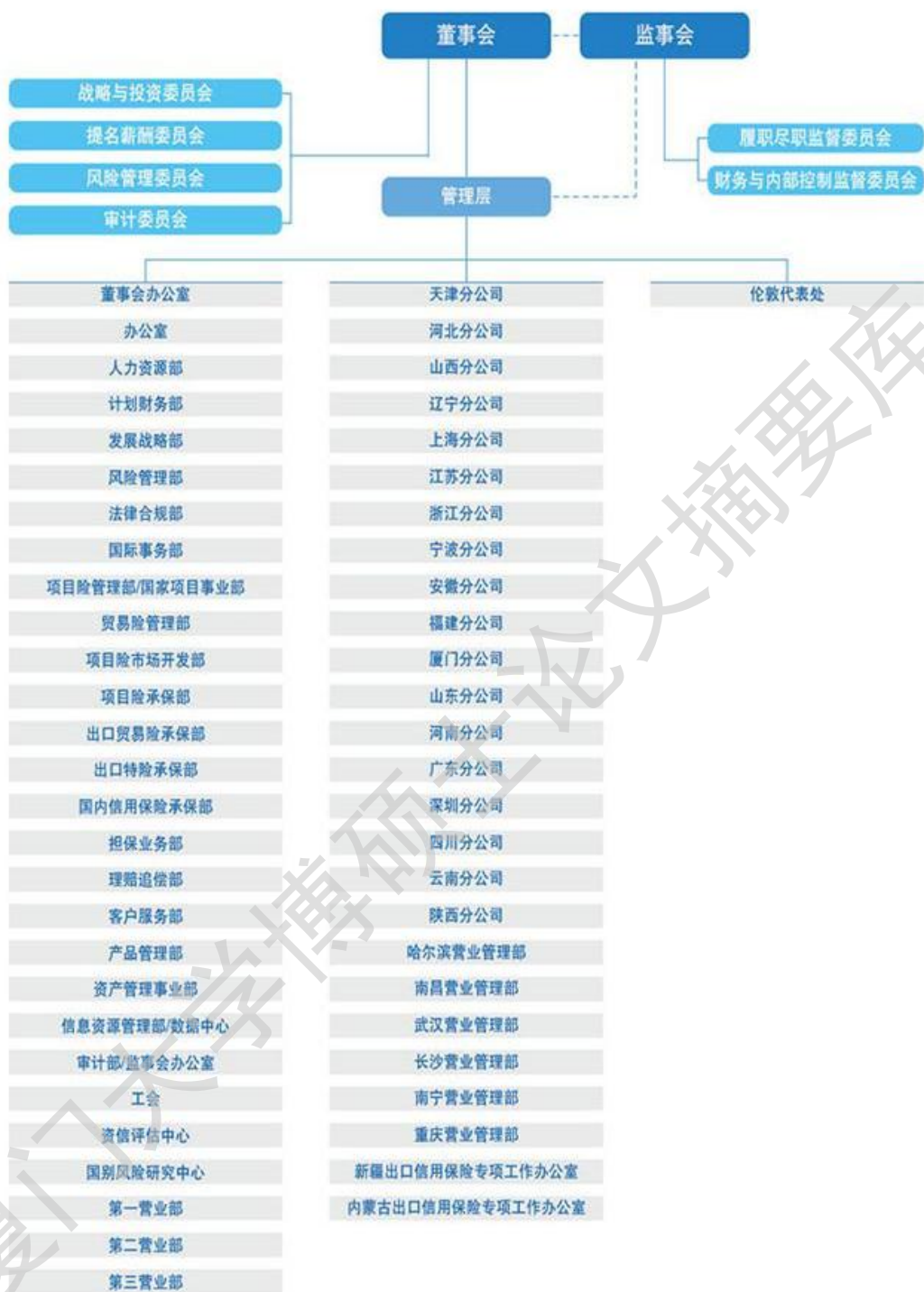
图 1-2 中国信保组织机构图