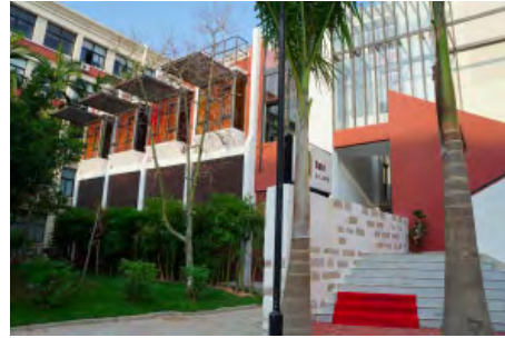
图 3- 改造后咖啡厅前广场