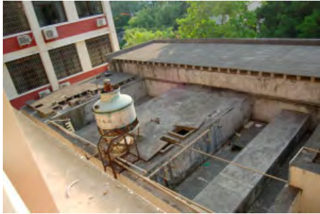
图 1- 原配电房屋顶