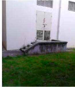
图 2- 原配电房入口