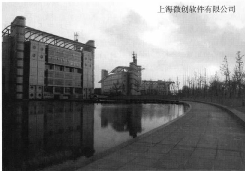
上海微创软件有限公司

券、增值税融资等。城市政府常规性的参加到公私合作关系之中来完成城市复兴项目和再发展项目。此外,政府租赁局和该部门通过发行产业收益债券来资助私营制造业和商业发展。在涉及体育设施管理方面,城市政府通过体育设施命名权、处罚税、博彩、特殊证照收费出售、售票盈余、特殊评定税额区等方法来创设城市建设基金。与此同时,“企业家型城市”内涌现出大量专门从事经济发展的准政府机构实体,逐步替代原先的公共行政部门。如英国的区域发展司、德国北莱茵——威斯特法伦州的区域机构等。这些公私合作的管理机构基于个案协商来开展经济决策,从而取代了原来的行政决策命令。