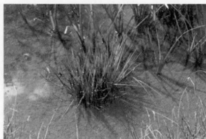
图 1 东方水韭生境 Fig. 1 The habit of I. orientalis

轴面圆形凸起,长 10~30 cm,中部宽 2~4 mm(干后宽 1~3 mm),向上渐细(图 2).叶横切面呈半圆形,内具 4 个纵行气道围绕中肋,且气道内具有横隔膜(图 3).叶基部扩大呈鞘状,膜质,黄白色,腹部凹入形成一凹穴,其上有三角形或三角形渐尖的叶舌,长 1.5~4 mm,宽 1~1.5 mm(图 4).凹穴内生有倒卵形的孢子囊,孢子囊长 7~13 mm,宽 3.5~5 mm,具白色膜质盖;大孢子囊常生于外围叶片基部的向轴面,内有多数白色和灰色球状四面形的大孢子,其表面具有明显的脊状突起,且连接成网络状;小孢子囊生于内部叶片基部的向轴面,内有多数白色的小孢子,其表面的突起不甚明显(图 4~5).