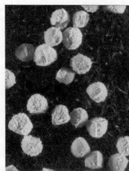
图 5 东方水韭的大孢子 Fig. 5 The macrospore of I. orientalis