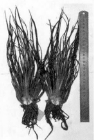
图 2 东方水韭纵切 Fig. 2 The longisection of I. orientalis